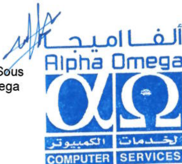
Nader Al Sous Alpha Omega